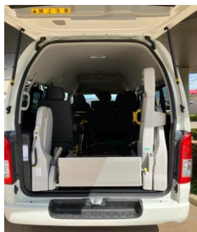
車いす仕様・リフト式・使用風景