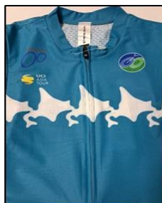
個人総合ポイント賞