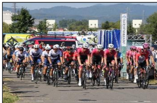
第1ステージスタート (旭川市総合防災センター前)