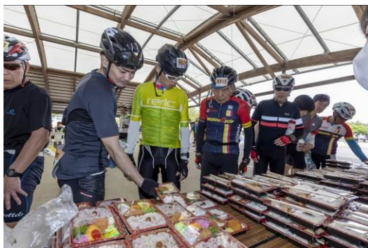
弁当ステーション風景(両津)

種目：Sコース(佐渡縦断) 190km、Aコース(佐渡一周) 210km、 Bコース(佐渡半周) 130km、Cコース(佐渡半周) 100km