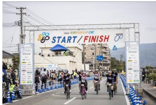
ゴール風景(佐和田)