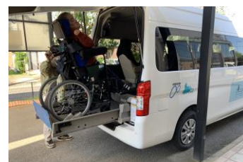
<実際にリフトを利用する様子>

車いすを利用しているご利用者4名（車いすの大きさによっては3名）の送迎等に活躍しています。ご利用者、ご家族からの喜びの声もいただいております。