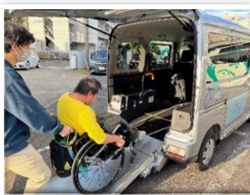
施設駐車場(送迎時)