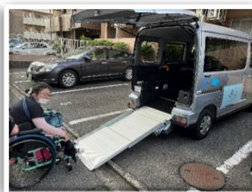
利用者自宅前(送迎時)