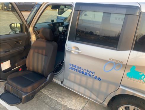
助手席リフトアップ装備 自動ボタンで助手席が下がります。