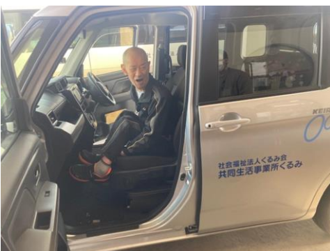
利用者さんが乗車した様子。 「乗降が楽になった」と感想ありました。