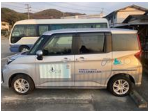
助手席リフトアップ装備の福祉車両 「ルーミー」外観。

(URL) https://kurumikai.jp/publics/index/56/#page-content