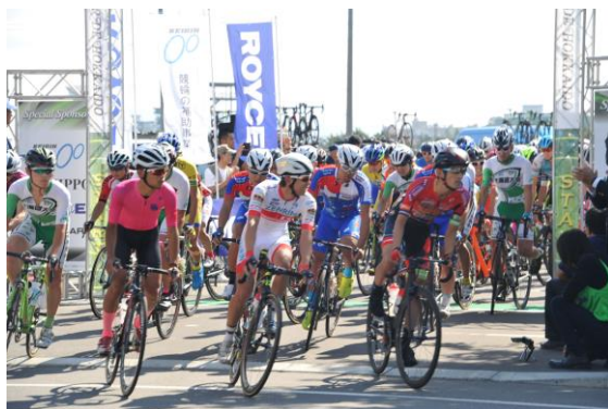
9/8 第1ステージ 函館競輪場スタート

平成29年9月8日から9月10日までの3日間、函館市を中心とする北海道の道南地域2市7町において、UCI（国際自転車競技連合）公認の国際大会として、海外・国内から20チーム・選手98名が参加し、一般公道を使用した町から町へと巡る本格的ロードレースを実施しました。総走行距離424km。最終日、第3ステージのフィニッシュは「函館山山頂」。道南地域の美しい自然環境を舞台に、終始白熱したレースが展開されました。