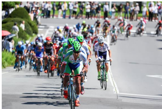
9/10 第3ステージ 函館山登山道手前の護国神社坂を 駆け登る選手団