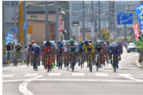
9/9 第2ステージ 集団ゴールスプリント(木古内町)