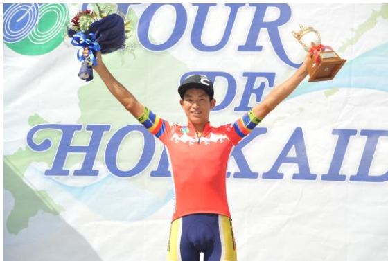
個人総合山岳賞 (9/10 函館市)