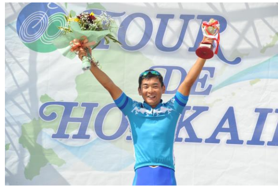
個人総合ポイント賞 (9/10 函館市)