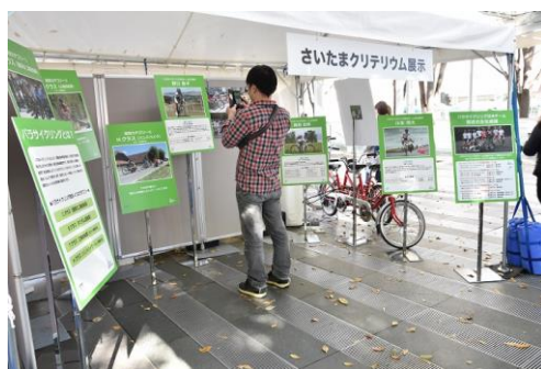
パラサイクリング啓発ブース