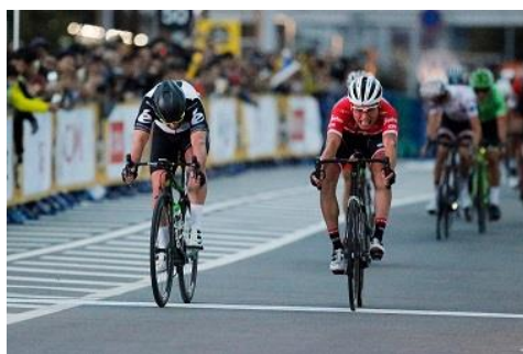
ゴール直前のスプリント