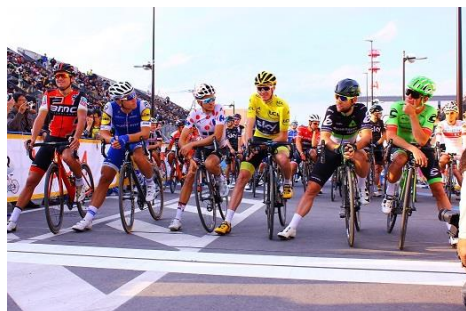
スタート前の選手