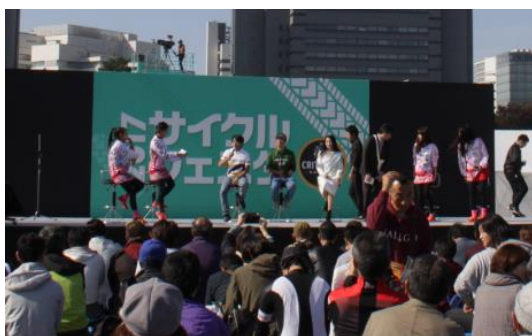
サイクルフェスタトークショー

大会前日及び上記レースと同日に、自転車競技の魅力を広く伝えると共に、自転車利用の促進や交通マナーの意識向上を図るイベントを、クリテリウムコース付近において実施した。ステージでの片山右京らによるトークショーのほか、特設周回コースを設置したキッズロアなどを行った。