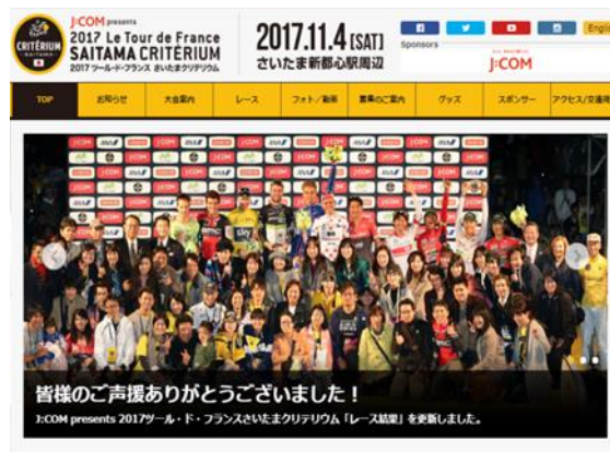
大会公式ホームページ