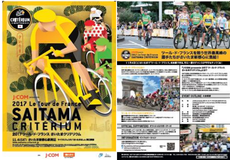
チラシ1版 (左→表 右→裏)