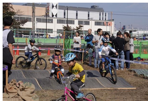
キッズロアの様子