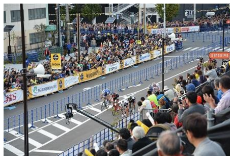
大観衆の前を疾走する選手