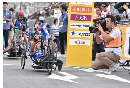
個人タイムトライアルレース②

また、個人タイムトライアルレースに参加した女子選手、男子ジュニア選手及びパラサイクリング選手を紹介するセレモニーを実施した。