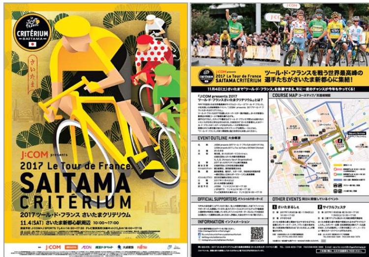
チラシ2版 (左→表 右→裏)