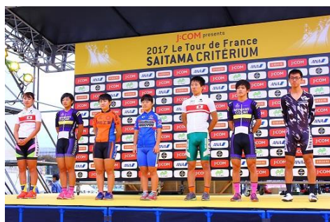
女子選手・男子ジュニア選手セレモニー

会場内では、パラサイクリング啓発ブースを設置し、競技紹介のパネルとともに、三輪自転車の車両を展示した。