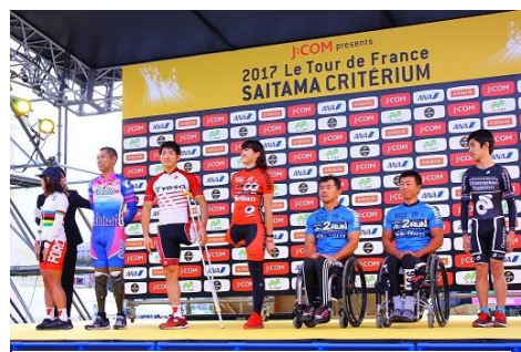
パラサイクリング選手セレモニー