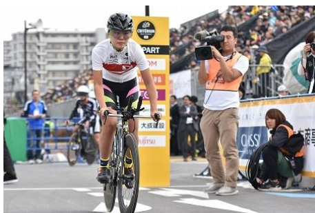
個人タイムトライアルレース①

女子選手は、エリート、ジュニアなどの各カテゴリーの上位選手4名がJCFにより選出され、パラサイクリング選手は、ハンドサイクル、三輪自転車、競技用自転車の3種から、世界選手権金メダリストやパラリンピック銀メダリストを含む7名がJPCFにより選出された。