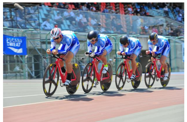
チームパーシュート