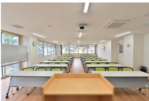
集会室兼地域交流室