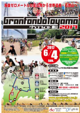
チラシ・ポスター