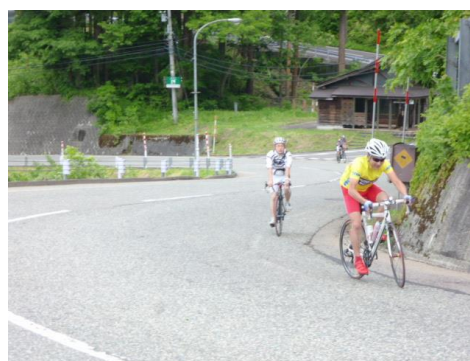
ロングコース (利賀で昼食)