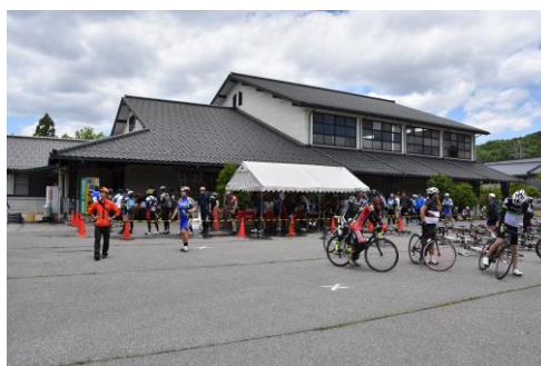
最後のチェックポイント (常願寺)