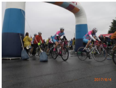
チェックポイントで休憩 (水記念)