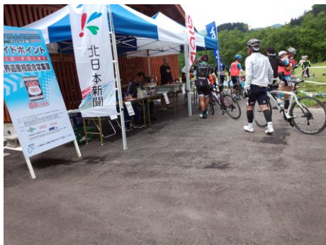
チェックポイントで休憩 (相倉)