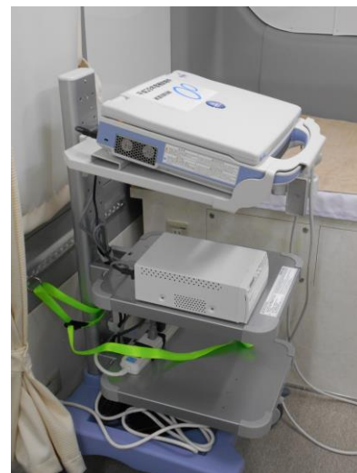
カラー汎用超音波 画像診断装置