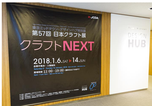
第57回日本クラフト展看板