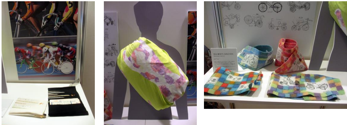
会員テーマ展示「自転車のある暮らし」