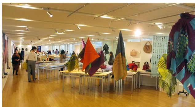
第57回日本クラフト展会場