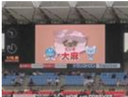
※サッカー会場での放映