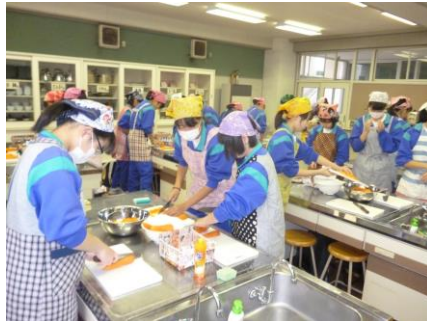
炊き出し調理と配給