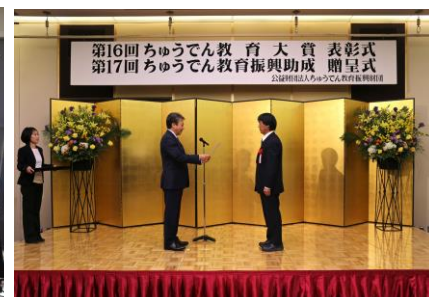
ちゅうでん教育大賞