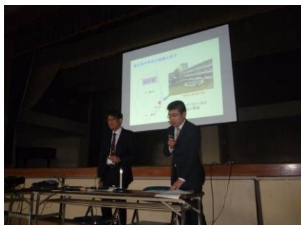
大学准教授と大学生の講演

本シンポジウムでは、生徒会が司会や進行を担い、大学准教授とその教え子の大学生が講演で共演し、取材報道班による取材結果と各訓練班の活動を紹介している。最後に教育委員会の防災訓練などの指導講評を行い、視聴参加者として本校生徒と地域住民などが共に防災教育を学んでいる。