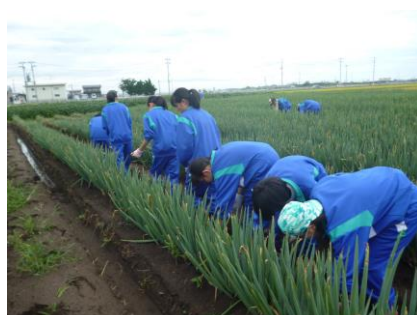
津波被災農家にて綿花畑の除草作業