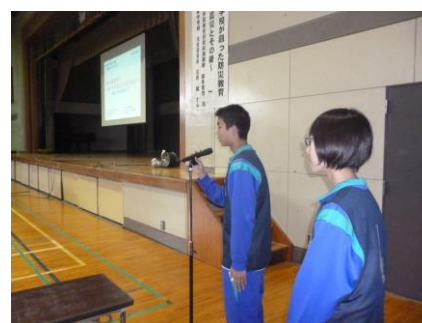
生徒会が司会進行