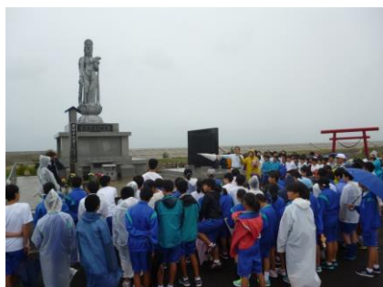
被災地を視察し慰霊塔で祈り

1年生・約200人が、仙台市沿岸部の津波被災地で農業を営む方々を支援するため、9月13日に被災地を視察し、その後に綿花畑の除草作業を行っている。大震災前は広大な水田地帯であったものの、津波の塩害が残る中、稲作に変わり手作業で綿花を栽培している。生徒たちは小雨が降るにも関わらず、懸命に除草作業に取り組んでいた。