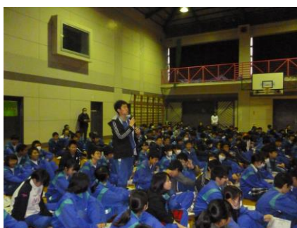
生徒の質疑や取材報道班の報告