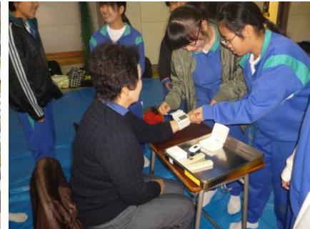
救急救護(血圧測定等)