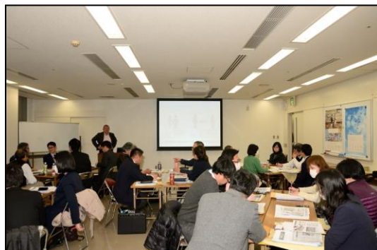
相談員養成講座 (平成30年2月9日 北九州)