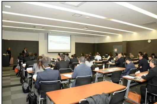
地域セミナー（平成29年11月13日 京都）