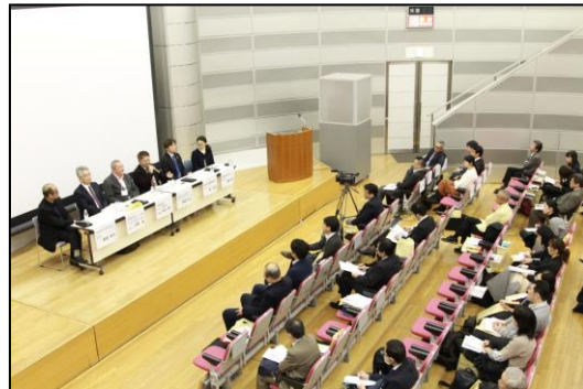
年次事業報告会（平成30年1月26日 東京）