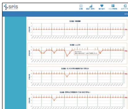
メンタルヘルス支援ソフト 画面サンプル (左：日報入力画面 右：統計グラフ画面)