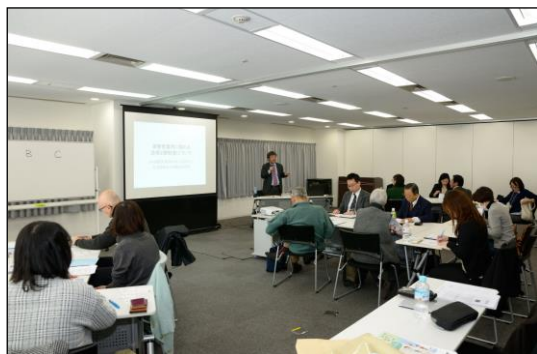
相談員養成講座 (平成30年1月27日 東京)