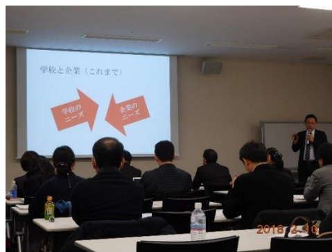
2月10日福岡セミナーの様子