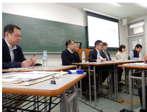
登壇者による質疑応答