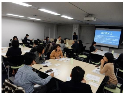
11月14日東京セミナーの様子