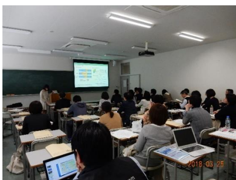
企業による事例発表

【備考】本報告会は、「第5回シティズンシップ教育ミーティング 第5分科会」としても位置づけ、実施。