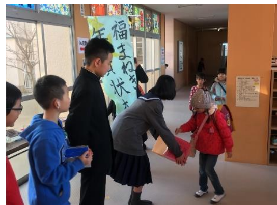
一人暮らしの高齢者に送る年賀状を買うために小中学校で募金活動を実施。