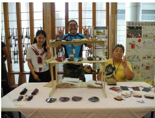
職場体験の一環で、企業のロビーで福祉作業所製品の販売手伝いを実施。

東京都 墨田区両国中学校 東京都 杉並区立杉並和泉学園 東京都 八王子市立四谷中学校 福岡県 福津市立福間中学校 熊本県 高森町立高森中学校