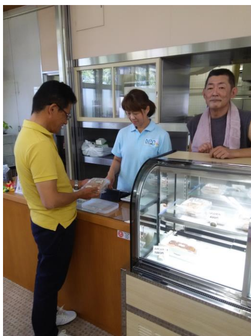
さあかすチャレンジド三豊 ふれあいcaféで販売