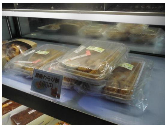
さあかすチャレンジド（綾川）内ショーケース