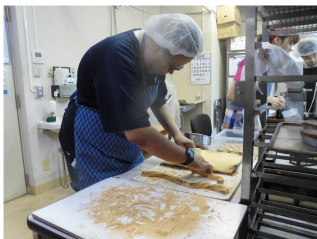
わらび餅 切り分け作業