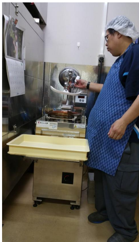
わらび餅 取り出し作業