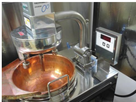
ITカスタードクッカー