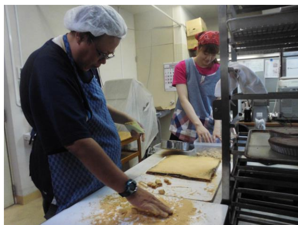
わらび餅 切り分け作業