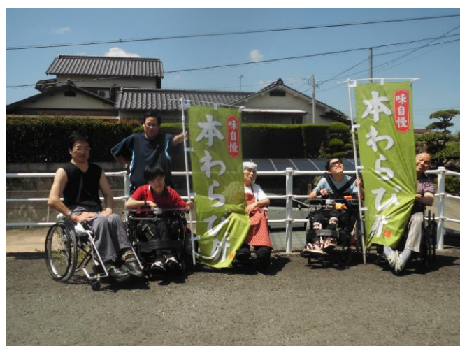
さあかすチャレンジド（綾川）施設前で宣伝