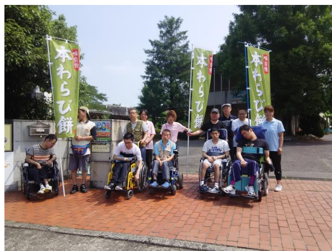
さあかすチャレンジド三豊施設前で宣伝