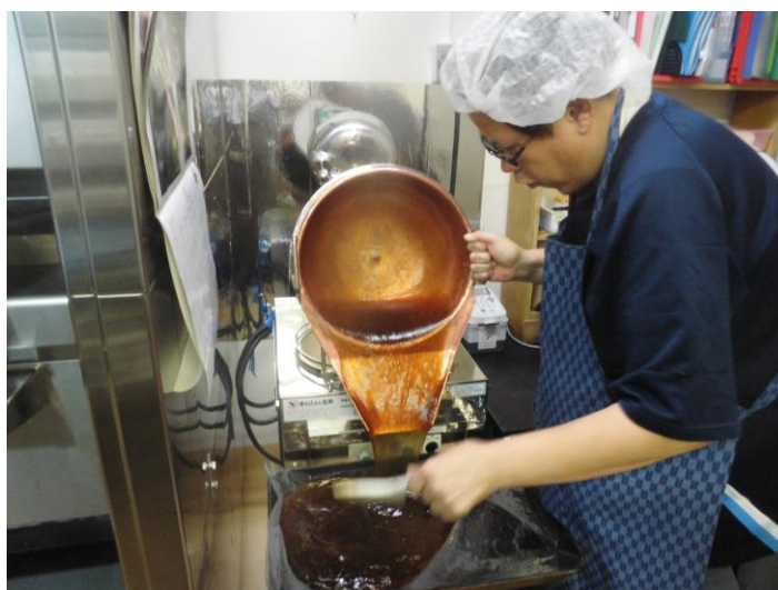
わらび餅 取り出し作業