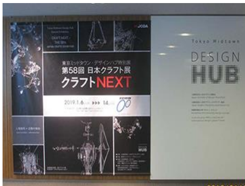
第58回日本クラフト展看板