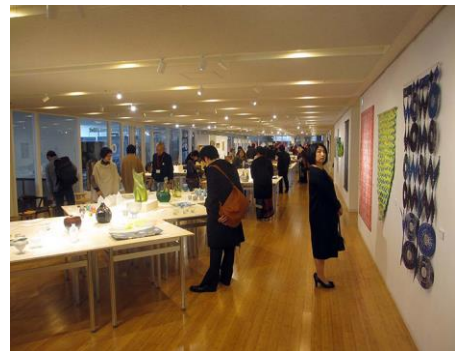
第58回日本クラフト展会場