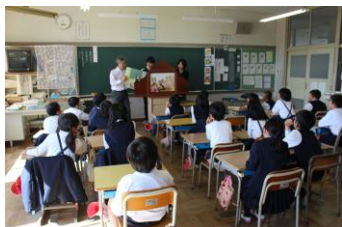
大型紙芝居で上演