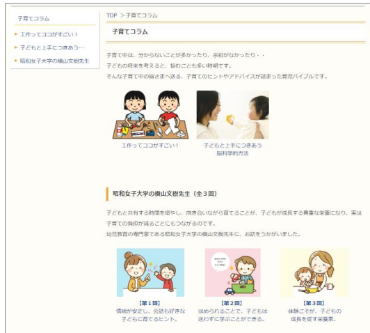
新設した「子育てコラム」