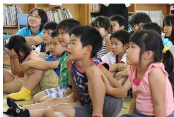
食い入るように見つめる子どもたち