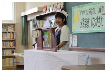
プロの声優さんが目の前で！