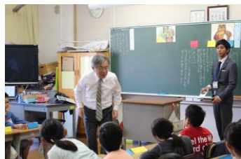
君はどう思うかな？