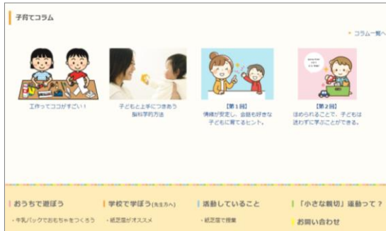
“てらこあん” トップページで紹介