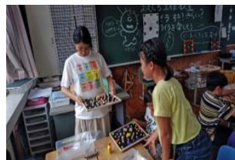
最後は先生も一緒に遊んじゃおう