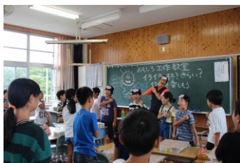
工作の前に、頭と体をほぐします！