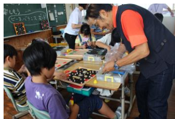
“ちゃんしの”が少しだけお手伝い