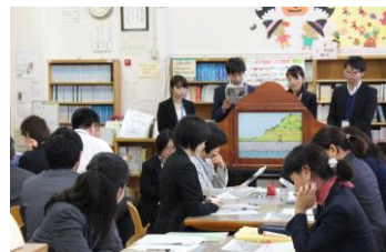
先生も勉強します