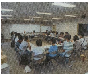
熱心に研修中 (島根)