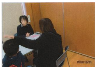
個別に丁寧に相談 (茨城)

我が子のコミュニケーションについて、様々な不安や悩みを抱える親が少子化にも関わらず増えている。職場の多忙化、貧困家庭の増加など、社会状況の変化により、会話を楽しむ機会が減ってきていること、食生活の変化など、要因は様々考えられるが、身近な地域での相談事業の実施により、具体的な手立てがわかったことで子どもの支援につながり、また、ことばの教室の設置のニーズが高いことも実証され、地域の親の会の活動に勢いがついた。