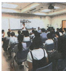
熱心に研修中（千葉）