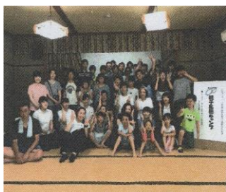
閉会式全員集合 (徳島)