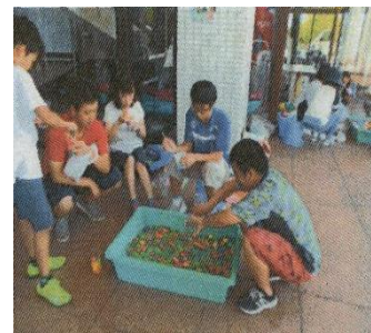
楽しいヨーヨー釣り (島根)