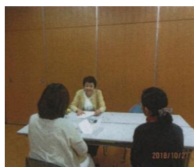
先輩からもアドバイス (佐賀)