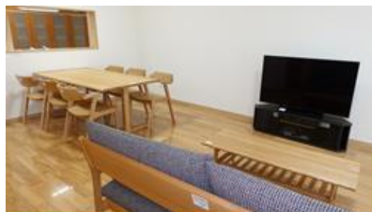
食堂兼リビング(初度調弁)