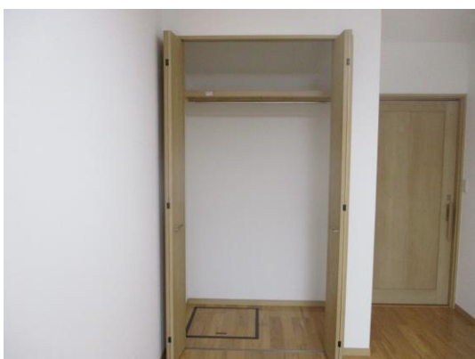
居室(クローゼット)